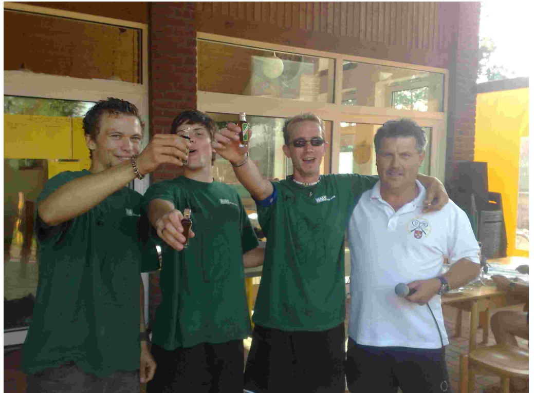
Das Siegerteam der Viktoria Winnekendonk