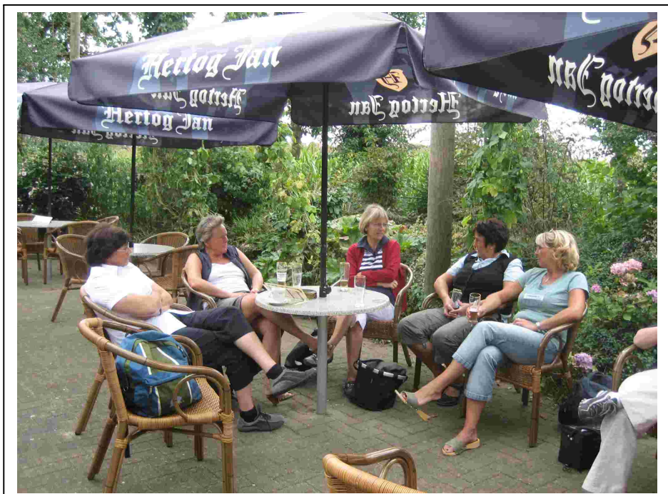
... der Brauereikneipe in Arcen.