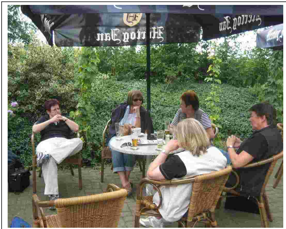
Unsere Damenmannschaft bei einer gemütlichen Pause im Biergarten ...

Besonders zu vermerken: Die Mannschaft war vollständig angetreten!