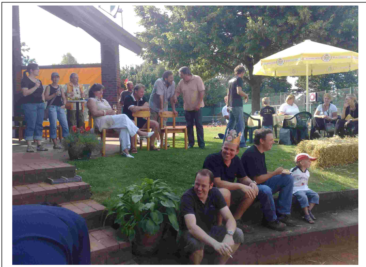
Zur Titelseite: Die Zuschauer beim Blind-Kick-Turnier hatten sichtlich viel Spaß an den akrobatischen Einlagen der Aktiven.